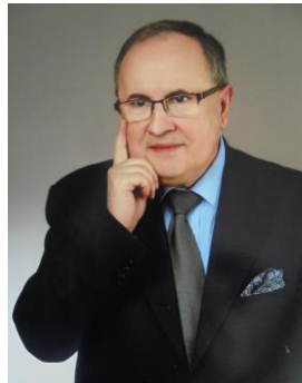
Król Polski-Lehii Leh XI Wojciech Edward I

2. Patronem „Zjednoczenia Narodowego Polaków” „UNITAS” jest: