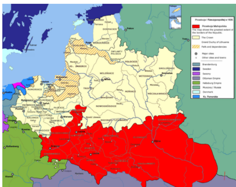
Korona Królestwa Polskiego A.D.1635

Podkarpacki Convent Pokoju ma związek ze Ślubami Lwowskimi oraz z dawną Ziemią Ruską i stosunkami Królestwa Polskiego z Rosją i Ukrainą.