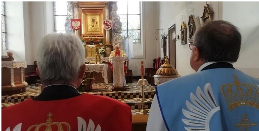
Foto kronika Aktu Poświęcenia Narodu Polskiego Sercu Jezusa A.D.2022 11 czerwca A.D.2022 Cedynia

Leh XI Wojciech Edward I Rex Poloniae-Lehiaie