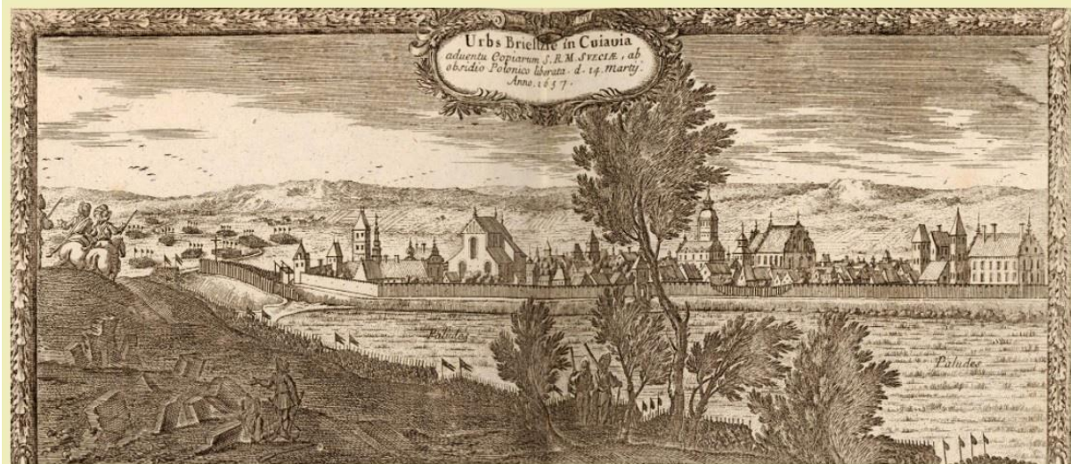
Zamek w Brześciu Kujawskim - Panorama miasta z zamkiem po prawej stronie na sztychu Erika Dahlbergha z dzieła Samuela Pufendorfa 'De rebus a Carolo Gustavo gestis', 1656 rok Ilustracja 10 z 10

Liczne i ważne zdarzenia uczyniły Brześć Kujawski miastem bardzo głośnym w dziejach kraju za Piastów i Jagiellonów. Tu Konrad, książę Kujaw i Mazowsza, chcąc zabezpieczyć swoje księstwa przed napadami pogan, nadał roku 1228 ziemię Chełmińską Zakonowi Krzyżaków.